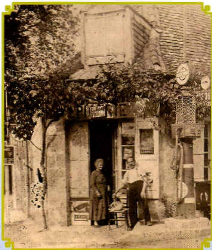
Lesparat au début du siècle...

Avec la démolition du «Sporting Club», Lesparat, cœur commercial historique de la ville, est en train de vivre de profondes transformations. Déjà Le Ready, ensemble de deux salles de répétition, et le Bâtiment Commerces et Services ont commencé leurs activités attendant l'implantation d'un giratoire qui assura une meilleure fluidité de la circulation et la sécurité du carrefour.