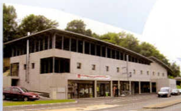
...l'ensemble commerces et services.